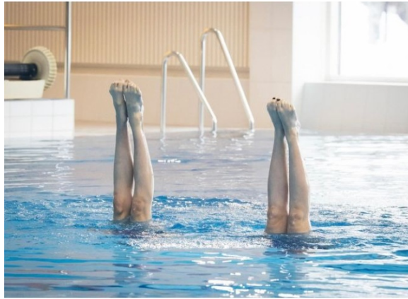
Kuva: Janne Passi